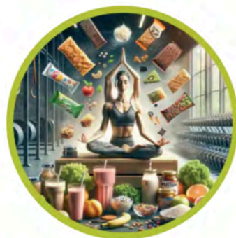
Benessere e Dimagrimento